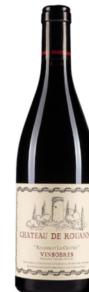
Chateau de Rouanne Vinsobres "Rouanne et Les Crottes"