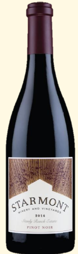
Stanley Ranch Pinot Noir