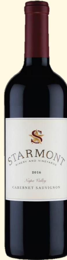
Napa Valley Cabernet Sauvignon