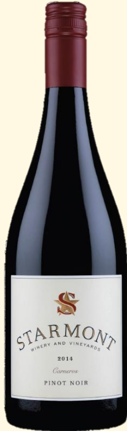
Carneros Pinot Noir