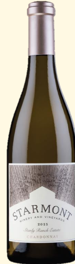
Stanley Ranch Chardonnay