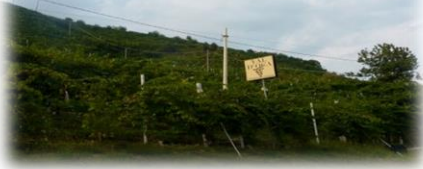
VAL DOCA Cartizze Vineyard