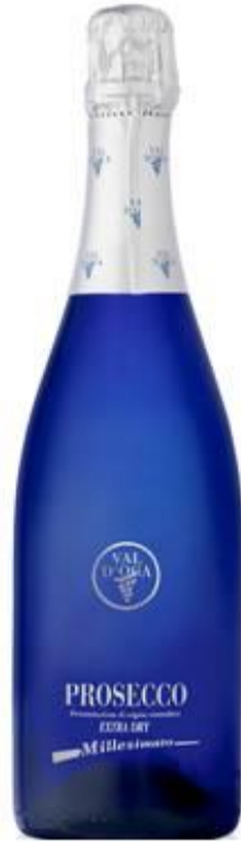
Prosecco Extra Dry Millesimato(Blue) 프로세코 엑스트라 드라이 블루